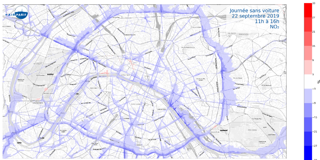
Carte de variations (%) des niveaux de dioxyde d'azote entre le dimanche 22 septembre, de 11h à 16h, et un dimanche moyen, pour la même plage horaire, dans la capitale : en bleu les baisses de dioxyde d'azote et en rouge les augmentations

Néanmoins cette journée s'inscrit également dans un contexte particulier compte tenu des importantes manifestations de la veille qui ont donné lieu à la fermeture par les forces de l'ordre de la place de la Concorde, pour des raisons de sécurité. De ce fait, la mise en place d'une déviation explique des augmentations localisées de niveaux de pollution, notamment autour du carrefour de l'Opéra (+6%, en rouge sur les cartes).